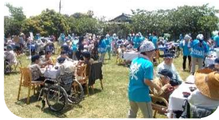
「とても良い天気でした♪」

ショートステイやデイサービスを利用されている方も含めた楽寿荘の利用者の皆さんと、来荘していたご家族の皆さんが、楽寿荘芝生広場に集まりました。まず、施設長のあいさつから、青空昼食会は始まりました。