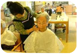
「いつも増してさらにお綺麗です♪」

「化粧品なんて何年ぶりだろう」「人によっても違うのは、緊張するね！」などお話ししながら、わくわくとした表情で、お化粧品が施されていく様子を鏡で眺めていました。