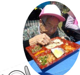
「アツアツの豚汁、美味しかったです♪」