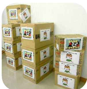
「東日本大震災の際には、多くの皆様のご支援をいただきました。その時の感謝の意味も込めて、職員より送らせていただきます。」

楽寿荘から、全国老人施設協議会事務局へ義援金と、熊本県荒尾市「特別養護老人ホーム 白寿園」へ身体拭きやおしぼり、栄養剤などの支援物資を送りました。