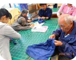
「良い色、良い柄ですね！」

五月十日(火)から五月十四日(土)までの五日間、デイサービスセンターではバスハイクを行いました。