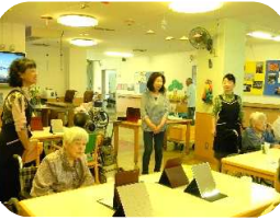
「お化粧品教室の皆さん、ありがとうございました！」

鶏ごぼうご飯・赤魚のおろしあんかけ・がんもの煮物・厚焼き玉子・いんげんのピーナッツ和え・マ