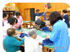
「どれも美味しくいただきました♪」

屋食はバイキング形式で、カレーライスやチャーハン、ラーメン、他にもサラダや揚げ物、果物があり、