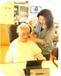
「ご自分でも真剣に、お化粧品していました！」

六月一日(日)、お化粧品教室の皆さんが来荘してくださいました。今回は三回目の開催で、西棟食堂にて行われました。