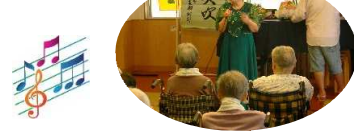
「たくさんの演目に拍手喝采！」