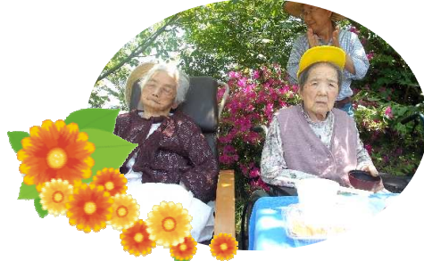
「東西横綱そろい踏み！」