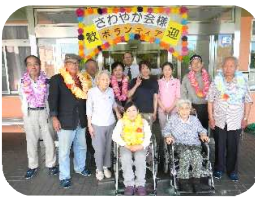
「利用者様と職員でお出迎えました♪」