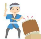
「ベランダからも見てました♪」