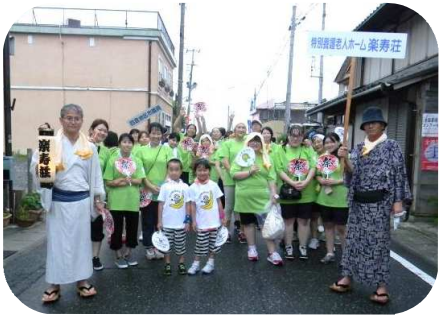
「雨にも負けず、踊りきりました♪ 来年も参加させていただく予定です!」

沿道の皆様の声援のおかげで、最後まで踊りきることができました。ありがとうございます。