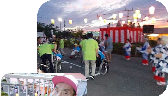
「太鼓とお囃子に、 自然と体が動きます!」