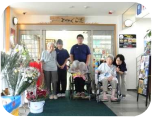
「また楽寿荘に来て下さいね♪」