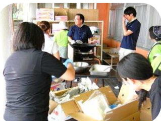
「早い時間から準備や設営していただきました」