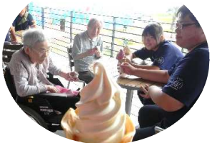
「自分の孫のように かわいいですね!」

七月三十一日(月) インターシニップで来た、ふたば未来学園の学生さん二名と、利用者三名、職員で、四倉道の駅までドライブに行ってきました。