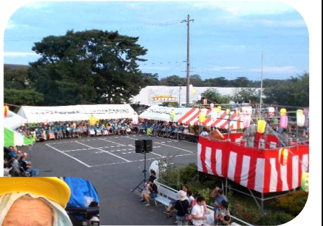
「天気も良くて最高です!」

沿道の皆様の声援のおかげで、最後まで踊りきることができました。ありがとうございます。