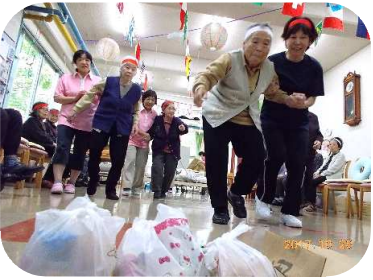
「宝をめがけ、一直線！」