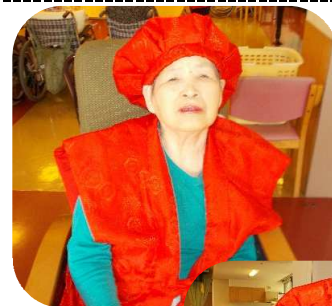
「歳を重ね、ますます綺麗になりますね♪」

九月二十五日(月)、この日、二階の喫茶室が駄菓子屋横丁になりました。くじ引きやじゃんけん勝負、モグラ叩きのコーナーが設けられました。また、飲み物コーナーでは昔ながらの紙芝居が披露されました。みなさん、子どもの頃に帰ったように楽しんでいました。