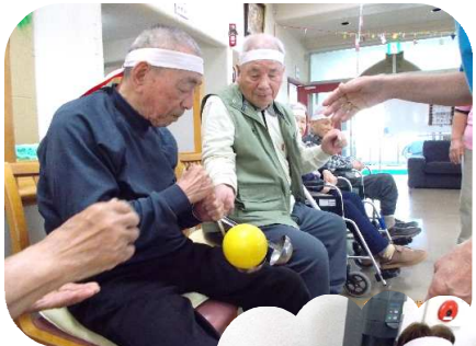
～ 玉おくり ～

頭にハチマキをしめ、気合は十分!おたまを使った玉おくりや、宝拾い、パン食い競争など、たくさん競技に取り組みました。