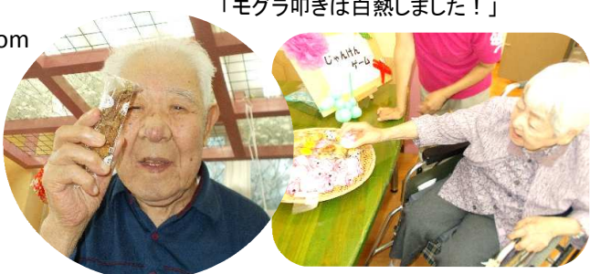
「モグラ叩きは白熱しました!」