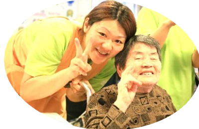
「さんま美味しかったよ～!」