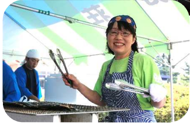
「みなさんの為に美味しく焼いています♪」