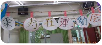
～ 宝拾い ～

十月二十三日から二十八日まで、楽寿荘デイサービスセンターでは、運動会が行われました。