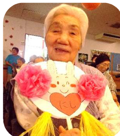
「応援もがんばりました!」