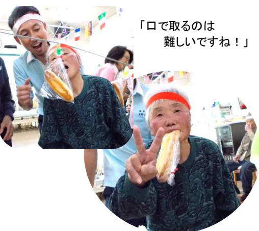
「口で取るのは難しいですね!」