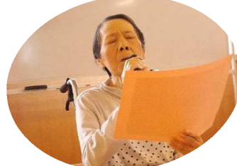
「一生懸命歌いました♪」