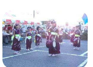
「小さいのにりっばに踊るね かわいいね！」