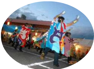
「ソイヤッ、ソイヤッ！！」