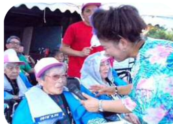
「孫という名の宝物〜♪」