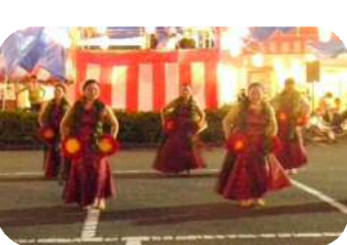
「きれいで見入っちゃいましたね♪」