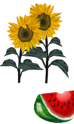
＜大野中学校の生徒さん＞

七月、大野中学校の生徒さんが楽寿荘に来てくれました。4人の生徒さんは、利用者の皆さんとのコミュニケーションをはかるきっかけにしたいと、自分達で考えてきた風船パレードと伝言ゲームで雰囲気盛り上げていました。