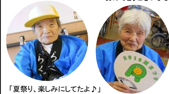
「夏祭り、楽しみにしてたよ♪」