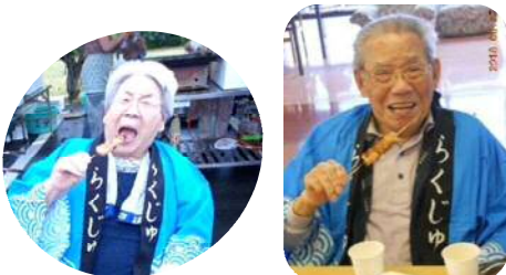
「大きいお口で、あ〜ん、ぱくり！」

遠慮がちにボールを投げる生徒さんのボールを、利用者さんは嬉しそうに受け取り、力を込めて投げ返していました。楽寿荘にまた来てくださいね！