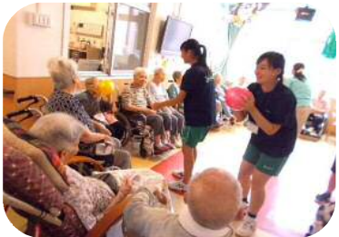
＜湯本高校の生徒さん＞

特に伝言ゲームでは、最後には思いもかけない言葉に変わっていて、みんなで答えを聞いて笑いました。八月にはサマーボランティアで湯本高校の生徒さんが来荘し、一人ひとりにキャッチボールを行いました。